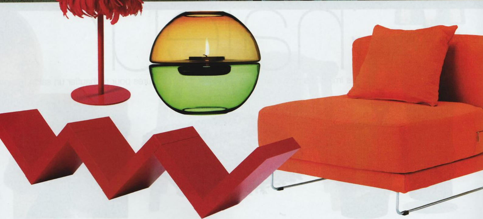
truc en plume. Lampe Bonne Femme , H. 60cm, design Mat & Jewski, 520 €, +Bo. Duo de couleurs. Photophore Planète en verre bicolore, diam. 28 cm, 32 €, design Marie Olofsson, +Bo. Zigzag. Petite étagère Lack , en panneaux de particules de bois, L. 30 x l. 26 cm, 3,95 €, Ikea. Vitaminé. Fauteuil Tylösand , Everöd, 270 €, Ikea.